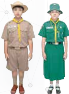
ชุดลูกเสือ-เนตรนารีสามัญ ประถม 4-6