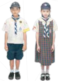
ชุดลูกเสือ-เนตรนารีสำรอง ประถม 1-3