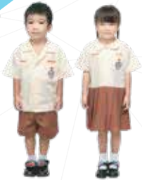
ชุดนักเรียน อนุบาล 1-3