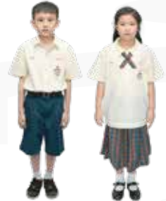
ชุดนักเรียน ประถม 4-6