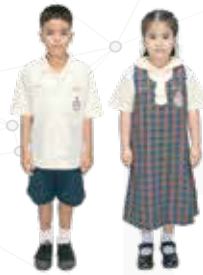
ชุดนักเรียน ประถม 1-3