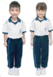
ชุดพลະอนุบาล 1-3 และ ประถม 1-6