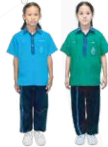
ชุดคณะสี ประถม 1-6